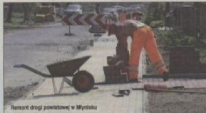
Remont drogi powiatowej w Młynisku

Artykuł współfinansowany przez Unię Europejską z Europejskiego Funduszu Rozwoju Regionalnego.