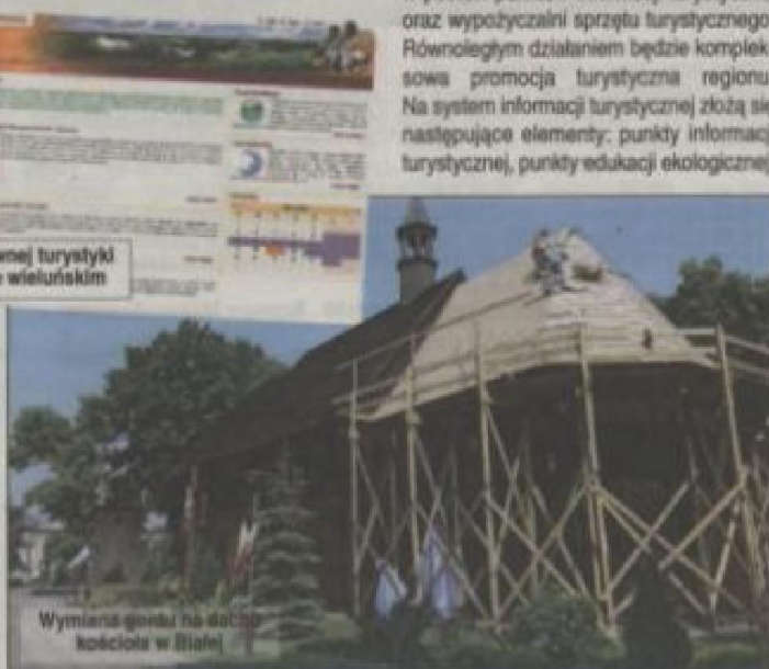
Wymiana gonki na dachu kościoła w Białej

Działania inwestycyjne polegają na przebudowie dróg powiatowych i gminnych wraz z towarzyszącą infrastrukturą. Na wybór lokalizacji przebudowywanych